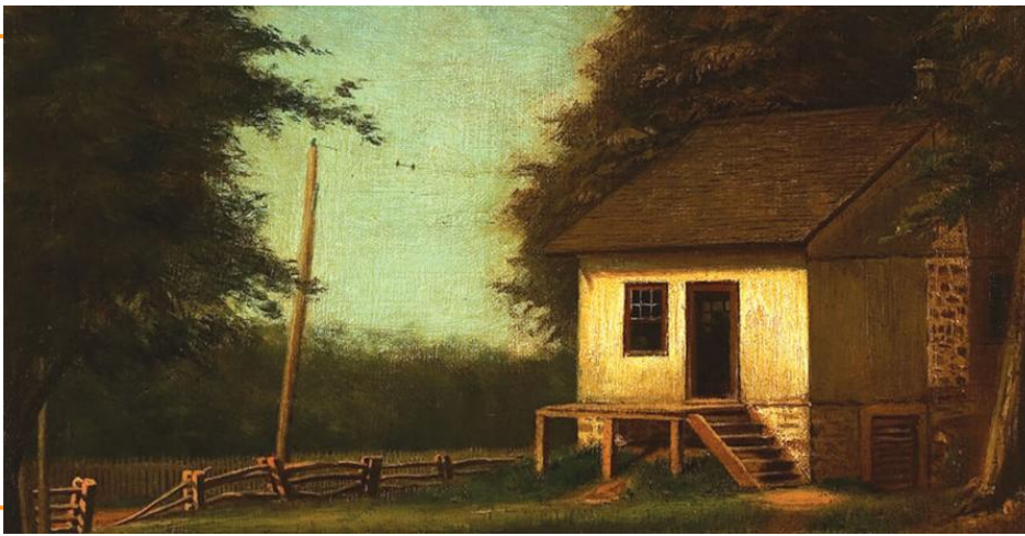
La maison natale, Ozias Leduc, v.1910

150, rue du Centre Civique Mont-Saint-Hilaire, Québec J3H 5Z5 Tél. : 450 536-3033 www.mbamsh.com reception@mbamsh.com