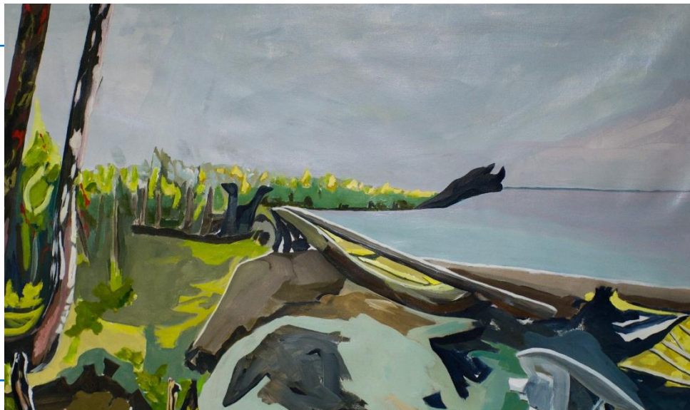
Forêt ancienne au temps de la préhistoire (détail), Denis Loisel, 2024