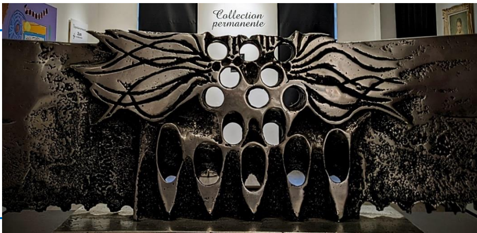
Sans Titre, Jordi Bonet, 1970