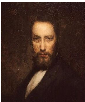
Ozias Leduc, Mon portrait , 1899

La programmation permanente, disponible en tout temps, est liée avec les trois artistes hilairemontois au cœur de notre mission. Les différentes activités permettent de découvrir sous un œil plus ludique, ou au contraire plus attentif, la démarche artistique de chacun des maîtres.