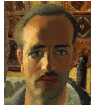
Paul-Émile Borduas, Autoportrait , v. 1928