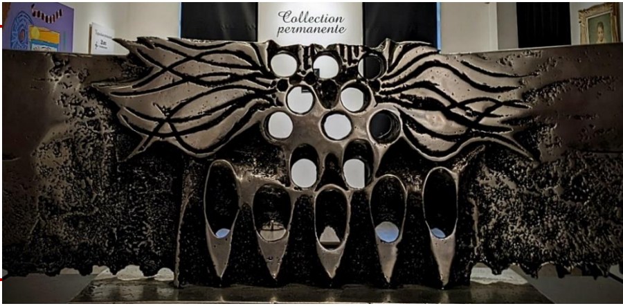
Sans Titre, Jordi Bonet, 1970