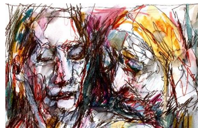
Michel T. Desroches, Je suis là pour toi (détail) , 2022