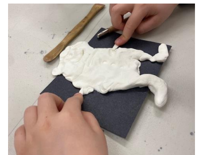
Élève en pleine création au printemps 2023