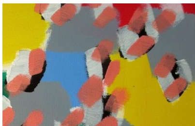
Marcel Barbeau, Rivage (détail) , 1997

Les enfants découvriront que l'art de composer une image est clef dans la photographie. Ainsi, ils seront mis au défi par l'animatrice.teur d'assembler une image digne des grandes règles de la photographie.