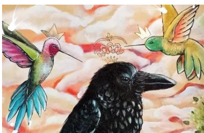
Deau, Les trois reines de la Béatitude (détail) , 2022, gagnant du prix jeune public