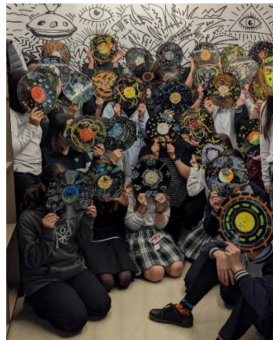
Groupe scolaire en visite au printemps 2022