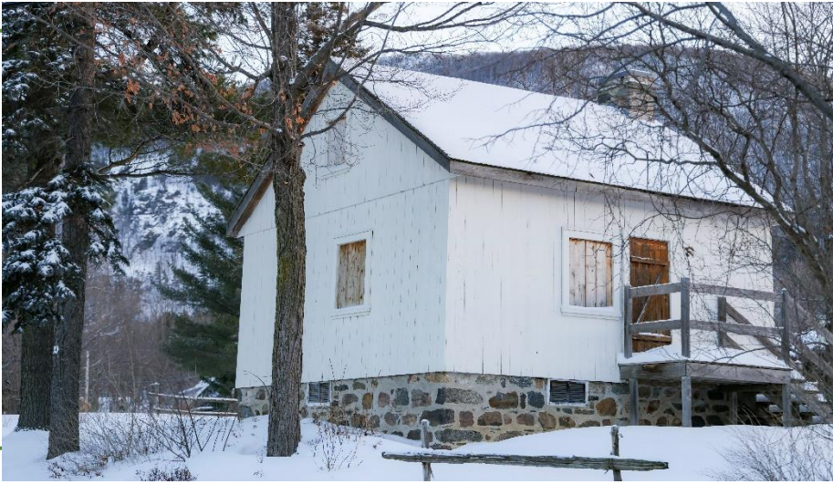
Maison natale d'Ozias Leduc