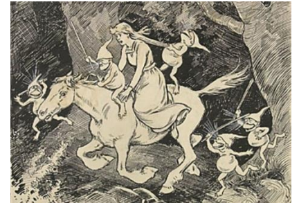
La mariée et les lutins, Henri Julien, 1905

Joe le cook vous raconte sa péripétie de jeunesse lorsqu'il se fait entraîner dans la chasse-galerie. En reprenant le célèbre conte d'Honoré Beaugrand, nous invitons les enfants à découvrir l'une des légendes les plus célèbres du Québec.