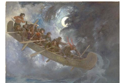
La chasse-galerie, Henri Julien, 1906

Coût : 10$ pour 1 adulte et 1 enfant / conte (5$/personne supplémentaire) 25$ pour 1 adulte et 1 enfant / série de 3 contes *10% de rabais pour les membres