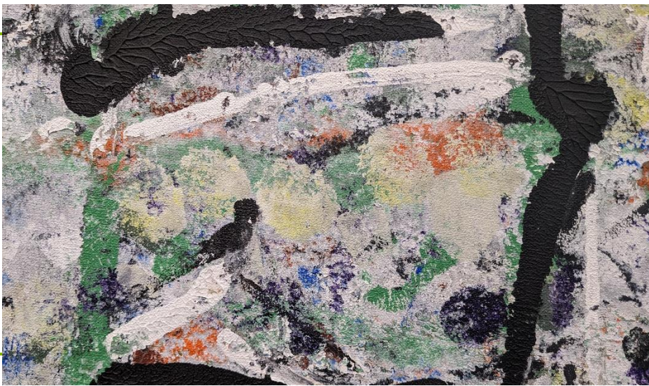
Riopelle, Sans titre (détail) , 1975