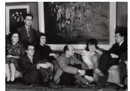
Perron, Seconde exposition des Automatistes (détail) , 1947