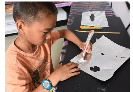
Atelier créatif au Musée

Pour inscription : education@mbamsh.com ou 450 536-3033