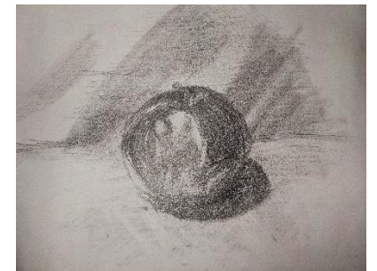
Pomme , exemple d'un dessin de nature morte simple