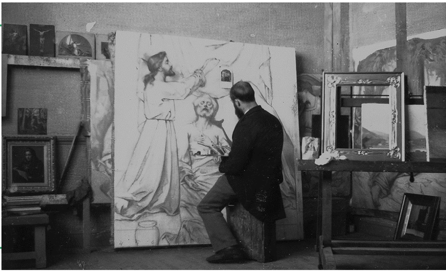
Ozias Leduc au travail à l'intérieur de Correlieu, Photographe inconnu, 1899