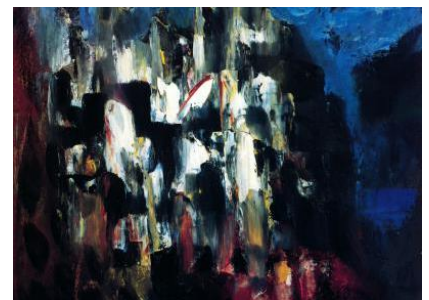
Les voiles blancs du château-falaise, Borduas, 1949