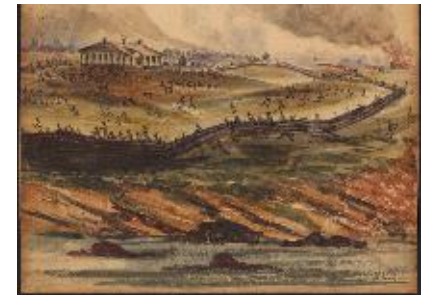
Bataille de Saint-Charles, Edward Adams Clark, v. 1837