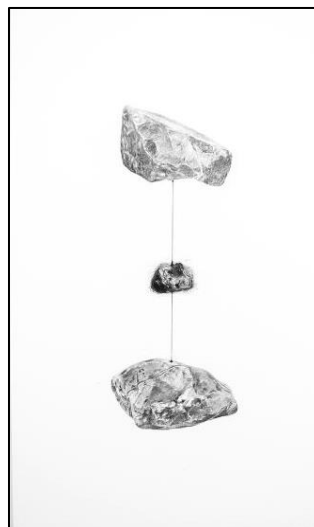
Christian Parent, L'amour ne tient quelquefois qu'à un fil , 2017, (œuvre présentée à la 8 e biennale du dessin)