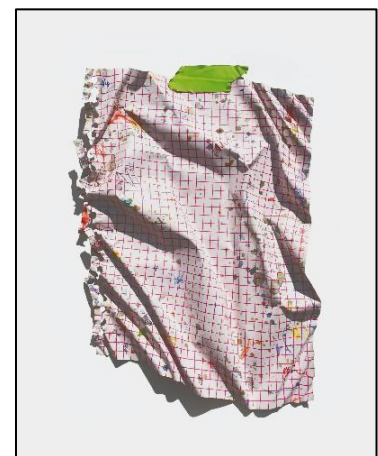
Sébastien Gaudette, Lexique des lignes troubles (Mauve) , 2020