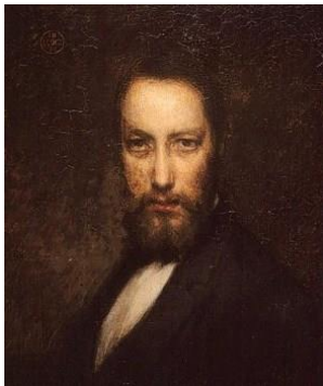
Ozias Leduc, Mon portrait, 1899

En marge des expositions, le service éducatif du MBAMSH offre un éventail d'activités d'exploration artistique aux groupes scolaires de tous les niveaux. Mettant l'accent aussi bien sur la théorie que sur la mise en pratique de techniques artistiques variées, ces ateliers remplissent l'importante mission d'éducation, de partage des connaissances et de sensibilisation aux multiples formes d'arts visuels que s'est donné le musée. La programmation permanente, disponible en tout temps, est liée avec les trois artistes hilairemontois au cœur de notre mission. Les différentes activités permettent de découvrir sous un œil plus ludique, ou au contraire plus attentif, la démarche artistique de chacun des maîtres.