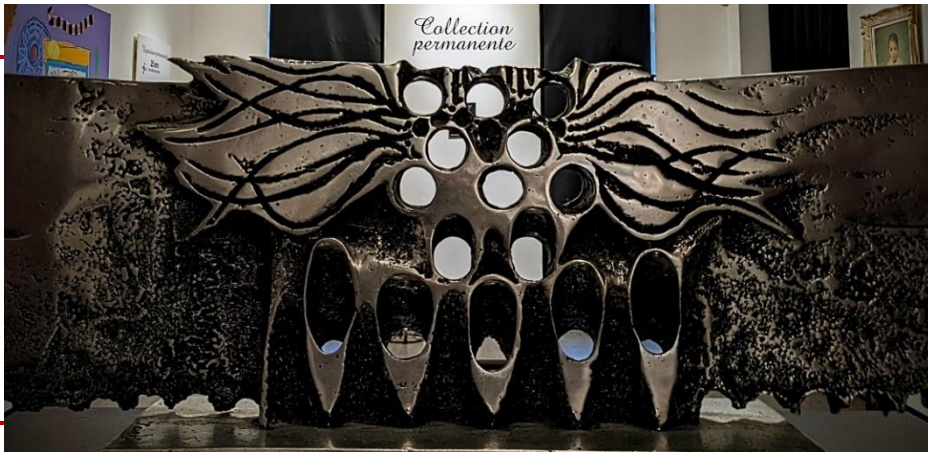
Sans Titre, Jordi Bonet, 1970