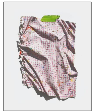
Sébastien Gaudette, Lexique des lignes troubles (Mauve) , 2020