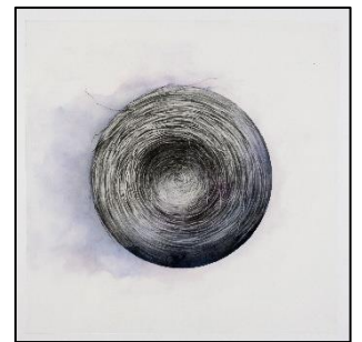
Nœud , Lorraine Dagenais

Inscriptions : 450 536-3033 ou reception@mbamsh.com